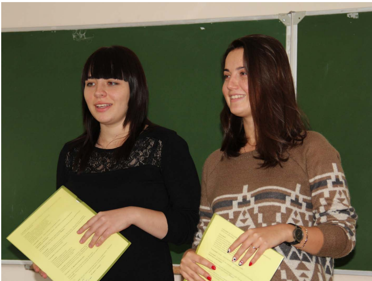
Заседание лингвистического клуба